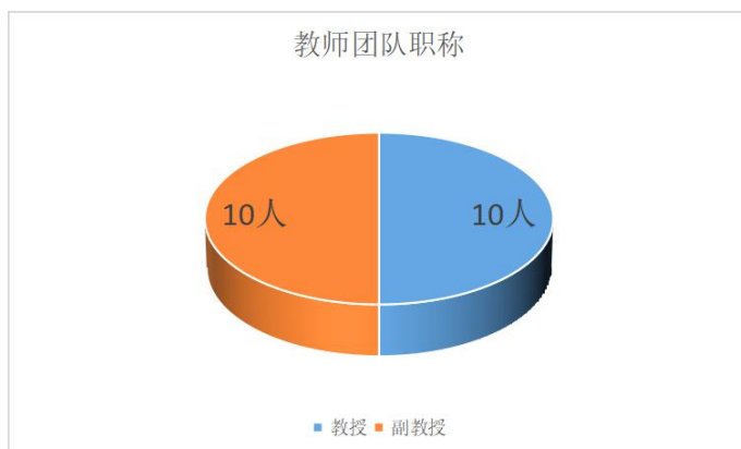
图 1：校内导师职称构成

学位点拥有一支学术水平优良、年龄结构合理、研究方向明确、全身心育人的精干导师队伍。校内导师人数为 20 人，其中教授 10 人，副教授 10 人，年龄 50 岁以下的占比 86%。行业导师是来自人民日报江西分社、江西日报传媒集团、江西电视台等一线资深媒体人员，人数为 9 人。